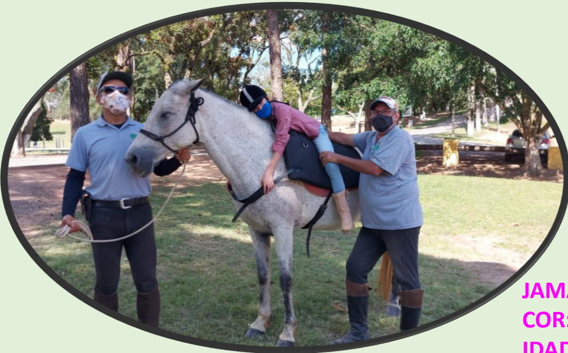
JAMAICA COR: TORDILHA RAÇA: MANGALARGA IDADE: APROX 9 ANOS