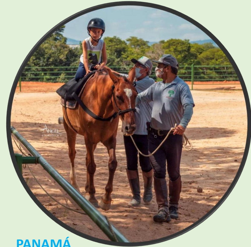
PANAMÁ MACHO CASTRADO COR: CASTANHO RAÇA: MANGOLINO IDADE: APROX 12 ANOS